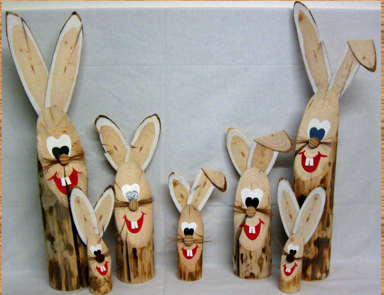
Osterhasendeko in verschiedenen Größen