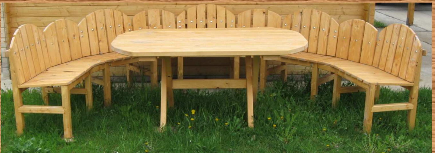
Abb. können Farbabweichungen zu den gefertigten Produkten haben.