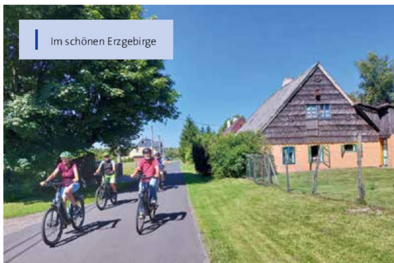
Im schönen Erzgebirge

Nach dem Essen mussten wir jedoch eine kleine Panne beheben: Der Tourleiter wechselte die Bremsbacken, was uns die Gelegenheit gab, ein wenig auszuruhen und die Umgebung zu genießen. Es ist immer wieder beeindruckend, wie schnell und effizient solche